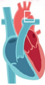
Coartación de aorta