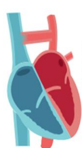
Drenaje venoso pulmonar anómalo total