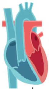
Transposición de grandes vasos